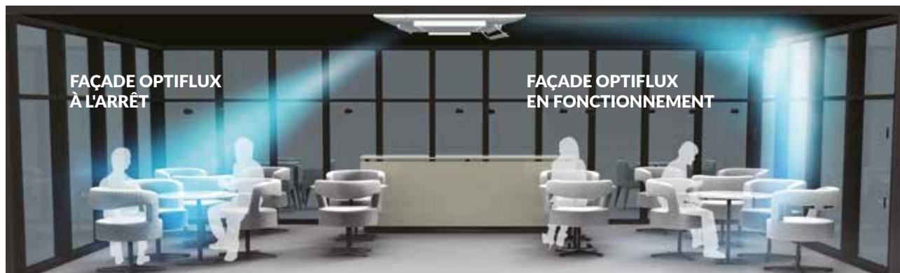
FAÇADE OPTIFLUX À L'ARRÊT