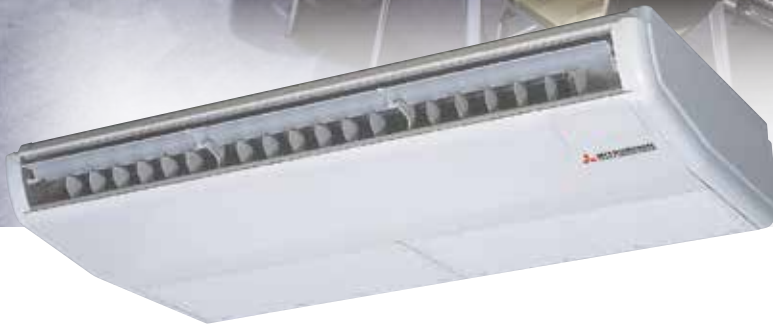
FDE40VH · FDE50VH · FDE60VH · FDE71VH FDE100VH · FDE125VH · FDE140VH