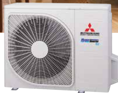
SRC20ZSX-W · SRC25ZSX-W · SRC35ZSX-W SRC50ZSX-W3 · SRC60ZSX-W3