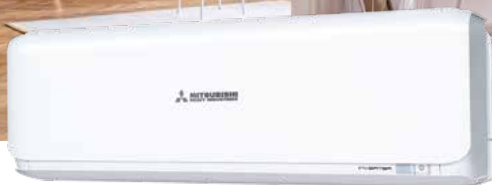
SRK20ZSX-W · SRK25ZSX-W · SRK35ZSX-W · SRK50ZSX-W · SRK60ZSX-W