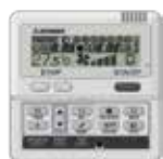
RC-E5 RC-EH5 (Chaud seul)