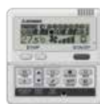
RC-E5 RC-EH5 (Chaud seul)